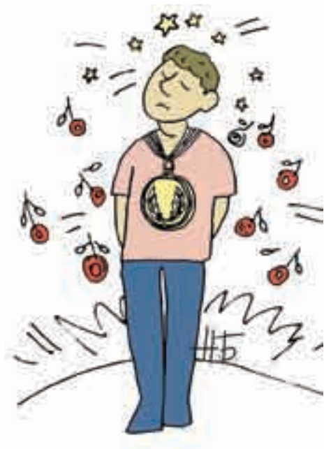
Награждается «За защиту семьи от Интернет-напасти».

Поддерживайте уровень безопасности вашего компьютера на должном уровне. Если ваш ребенок лучше вас разбирается в программном обеспечении, то почему бы не поручить ему заботу о безопасности ваших семейных компьютеров?